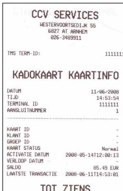
Afbeelding 5. Kaartinformatie rapport.

De betaalautomaat print nu een bon/rapport met de kaartinformatie (zie afbeelding 5).