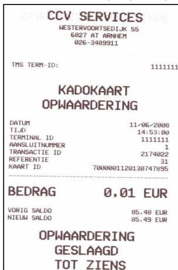
Afbeelding 4. Geslaagde opwaardering

Als de opwaardering is geslaagd, wordt er een bon geprint (zie afbeelding 4).