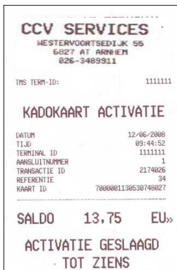
Afbeelding 1. Voorbeeld cadeaukaart activeren bon

Als het activeren is geslaagd, wordt er een bon geprint (zie afbeelding 1).