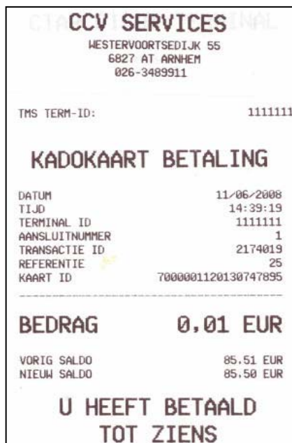
Afbeelding 2. Geslaagde transactie