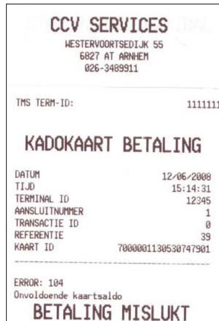
Afbeelding 3. Mislukte transactie

Lees hier de reden, indien een transactie mislukt